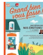
GRAND BIEN VOUS FASSE LES ÉMOTIONS Ali Rebeih mook - éd. Prisma Media parution : octobre 2020