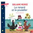
Le renard et le poulailler Guillaume Meurice illustr. Aurore Damant