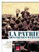
LA PATRIE DES FRÈRES WERNER Philippe Collin et Sébastien Goethals roman graphique éd. Futuropolis