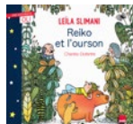
Reiko et l'ourson Leïla Slimani illustr. Charles Dutertre