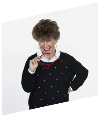
LAURENCE BLOCH DIRECTRICE DE FRANCE INTER