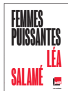
FEMMES PUISSANTES Léa Salamé livre éd. Les Arènes