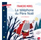
Le téléphone du Père Noël François Morel illustr. : Lili la Baleine