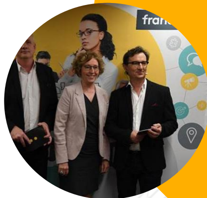
Muriel Pénicaud Ministre du travail lors de la conférence du 10 avril 2018

Mardi 10 avril | 19h30/21h30 DAH, entrepreneurs, PDG, salariés... Venez rencontrer les acteurs du monde du travail