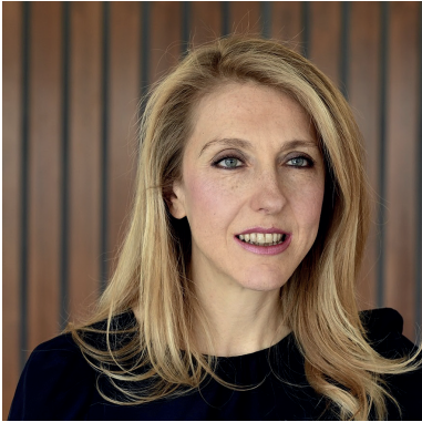
Sibyle Veil Présidente-directrice générale de Radio France

Tout l'été 2020, Radio France a affiché un cri du cœur sur la façade de la maison ronde : Maison de la radio... et de la musique ! Au cœur d'une pandémie qui allait mettre durablement à l'épreuve toute une génération, à un moment où la radio se réinventait pour être au rendez-vous d'un choc terrible, et alors que la filière culturelle et musicale entrait dans de grandes difficultés, cet été-là plus que jamais, Radio France tenait à être aux côtés de tous ceux qui cherchaient à retrouver le goût de la vie et la douceur d'être ensemble.