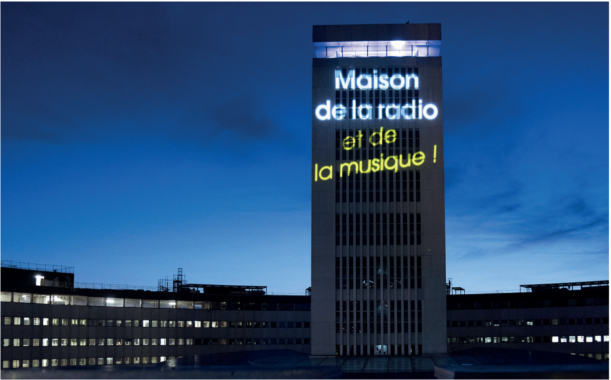
Radio France : La Maison de la radio... et de la musique !

Ainsi, chers Mécènes, votre engagement aux côtés de l'Institut de France et de Radio France servira le rayonnement de notre culture à l'intérieur et au-delà de nos frontières, la vitalité de l'art classique et de l'expertise journalistique. En d'autres termes, il servira admirablement les arts et la République des Lettres.