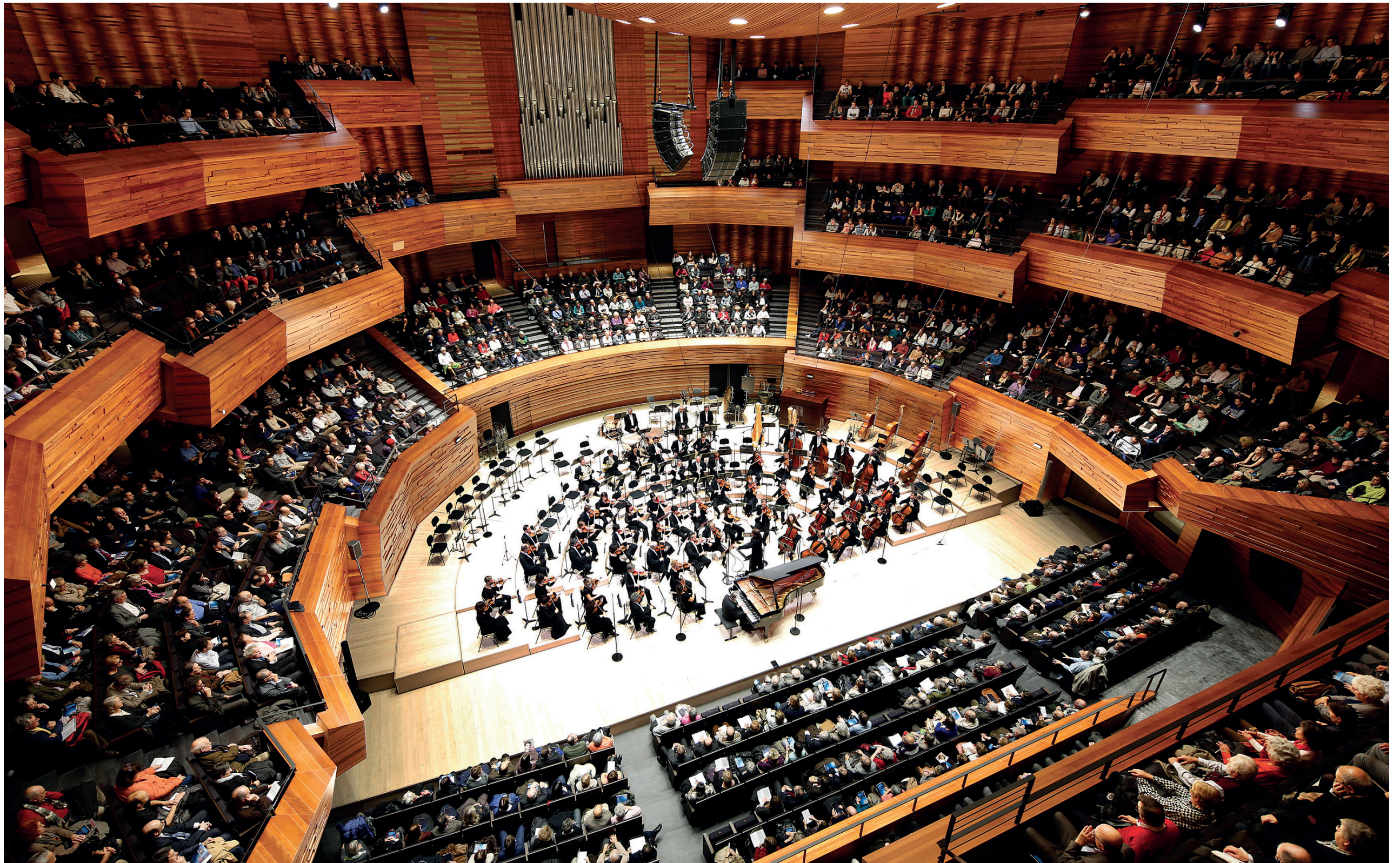
L'Auditorium de Radio France - Architecture Studio