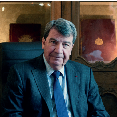
Xavier Darcos Chancelier de l'Institut de France Président de la Fondation Musique et Radio - Institut de France

C'est pourquoi nous sommes heureux à Radio France d'avoir une Fondation Musique et Radio qui porte nos valeurs, et de pouvoir compter sur le soutien de l'Institut de France, ainsi que de chacun des mécènes qui nous accompagnent et nous accompagneront dans d'enthousiasmants projets.