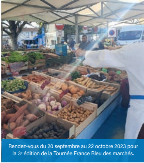
Rendez-vous du 20 septembre au 22 octobre 2023 pour la 3 e édition de la Tournée France Bleu des marchés.