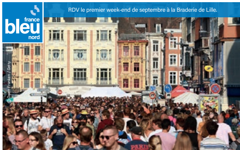
RDV le premier week-end de septembre à la Braderie de Lille.