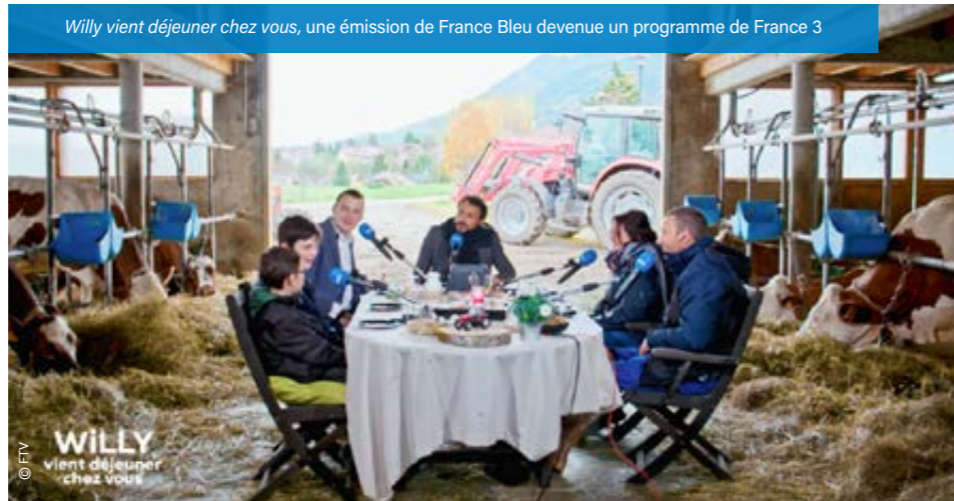
Willy vient déjeuner chez vous, une émission de France Bleu devenue un programme de France 3