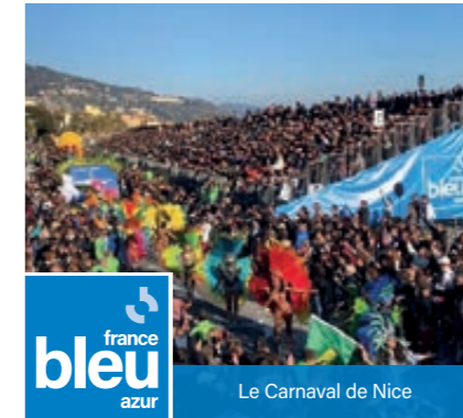
Le Carnaval de Nice