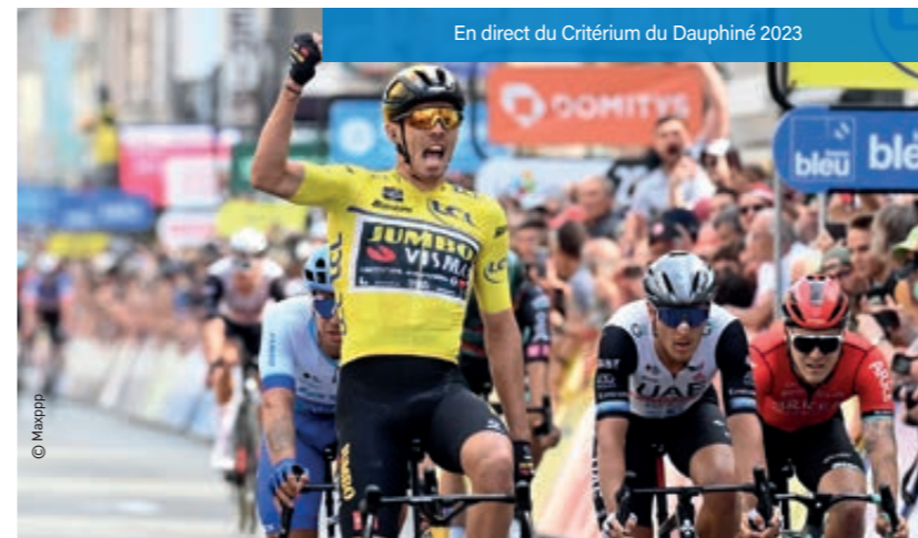
En direct du Critérium du Dauphiné 2023