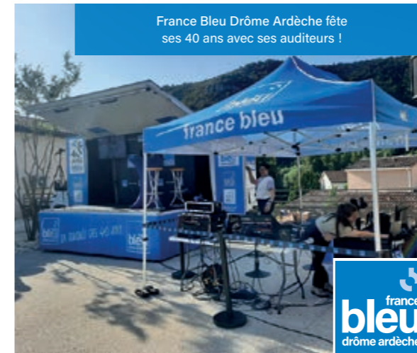
France Bleu Drôme Ardèche fête ses 40 ans avec ses auditeurs !