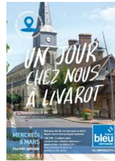
MERCREDI 8 MARS Journée spéciale