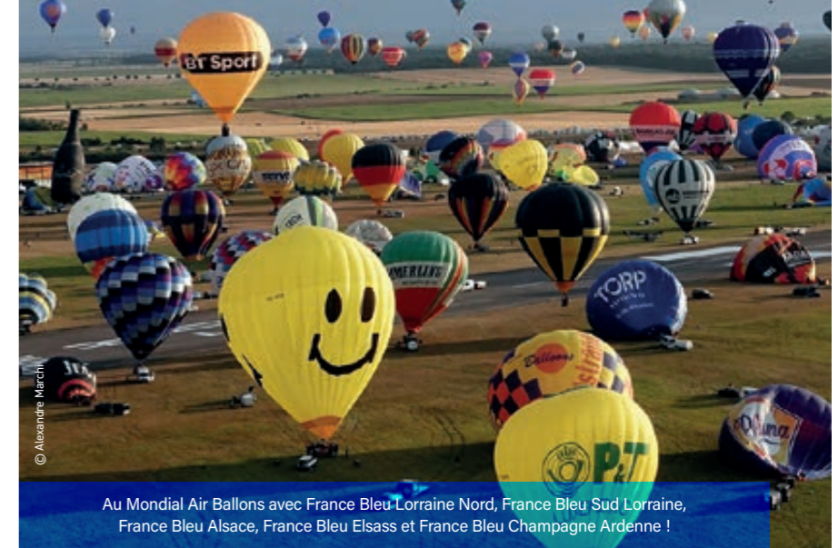
Au Mondial Air Ballons avec France Bleu Lorraine Nord, France Bleu Sud Lorraine, France Bleu Alsace, France Bleu Elsass et France Bleu Champagne Ardenne !