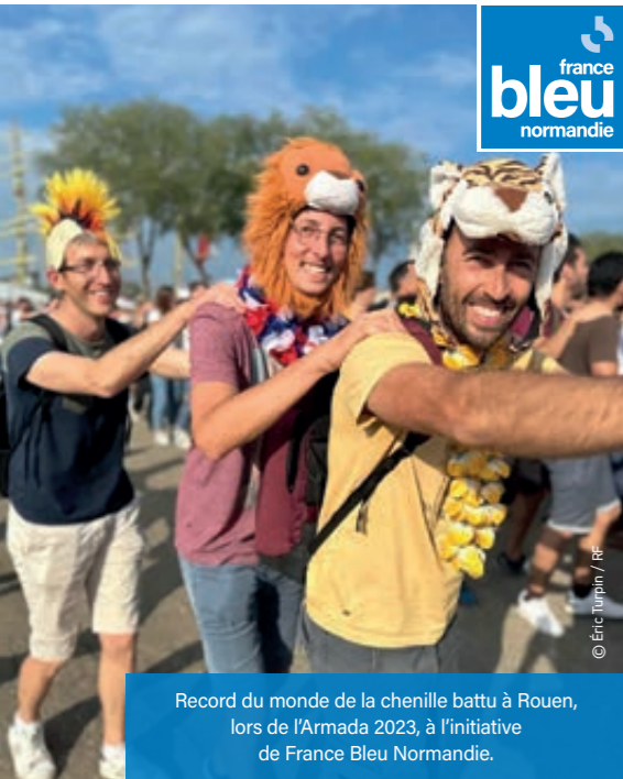
Record du monde de la chenille battu à Rouen, lors de l'Armada 2023, à l'initiative de France Bleu Normandie.