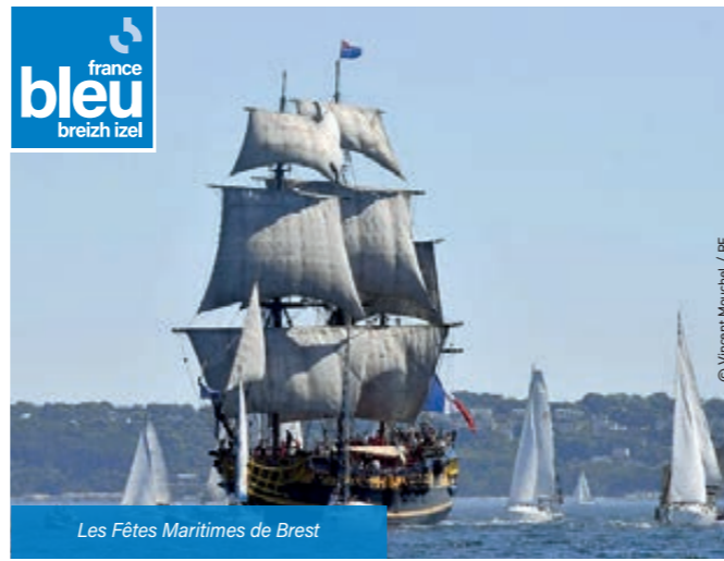
Les Fêtes Maritimes de Brest