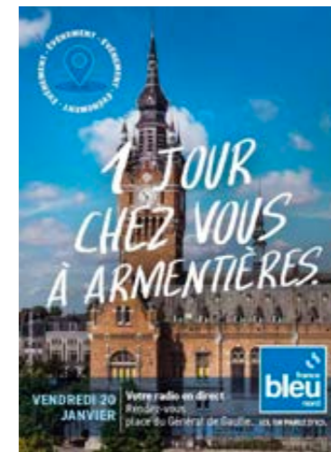
VENDREDI 20 JANVIER