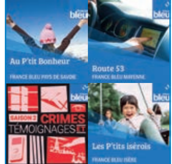
Au P'tit Bonheur