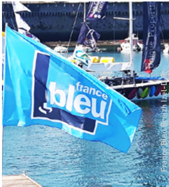
FRANCE BLEU AIME LE SPORT les 21, 22 et 23 septembre 2018