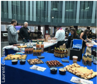
SAVOUREZ LA GASTRONOMIE AVEC FRANCE BLEU PARTENAIRE DE LA 8 e ÉDITION DE GOÛT DE FRANCE les 21, 22 et 23 septembre 2018

La proximité à travers la gastronomie et le sport