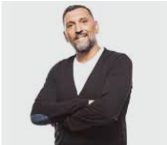
K-ZA / samedi de 23h à 00h