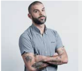
DJ PONE / jeudi de 22h à 23h