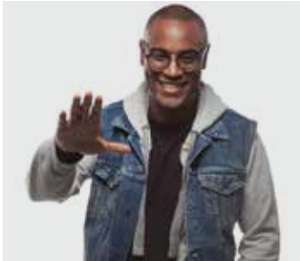
FIRST MIKE / samedi de 21h à 22h