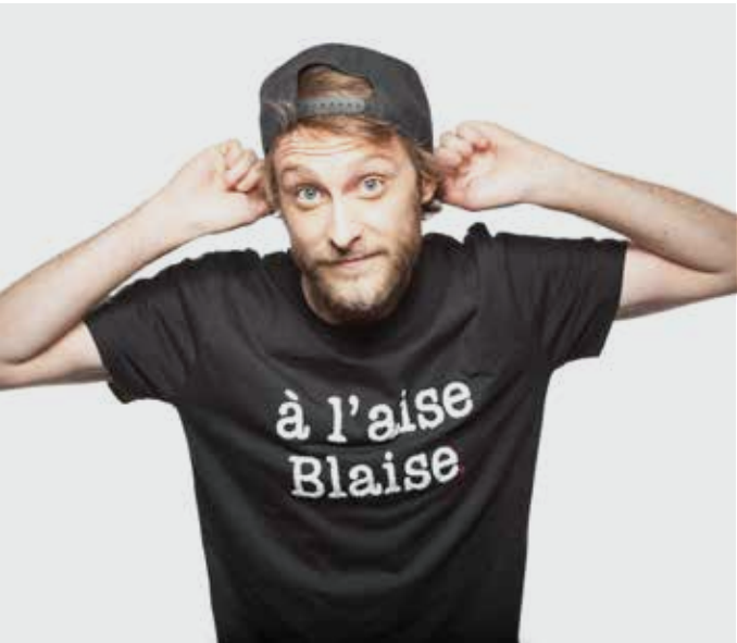
TOP MOUV' BOOSTER MORGAN du lundi au vendredi de 16h à 17h

Focus sur les nouveaux talents hip-hop : le Top Mouv' Booster est le classement quotidien des artistes francophones hip-hop établi grâce aux votes des internautes de Mouv'. Il met en lumière les artistes émergents de la scène française.