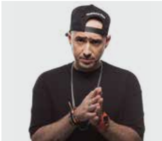
SEROM / mercredi de 22h à 23h