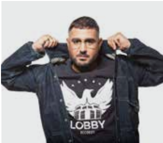
R-ASH / lundi de 22h à 23h

Puis, dès 22h, place aux Mouv' DJs. Alternant classiques et nouveautés, bousculant les frontières du hip-hop, la team des Mouv' DJs prend les platines pour distiller le meilleur du son hip-hop avec chaque soir, des sonorités et un univers reflétant la personnalité de chacun.