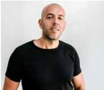
DJ MOUSS / samedi de 22h à 23h