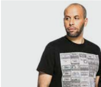
LA CAUTION / dimanche de 23h à 00h