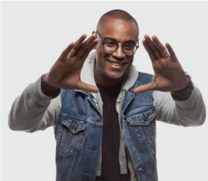
FIRST MIKE RADIO SHOW DJ FIRST MIKE le samedi de 21h à 22h

Focus sur les nouveaux talents hip-hop : le Top Mouv' Booster est le classement quotidien des artistes francophones hip-hop établi grâce aux votes des internautes de Mouv'. Il met en lumière les artistes émergents de la scène française.