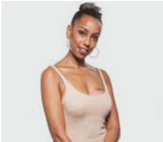
AYANE / dimanche de 21h à 23h