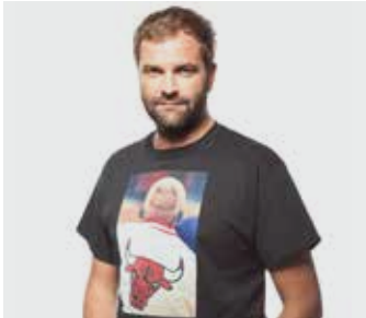
QUENTIN / mardi de 22h à 23h