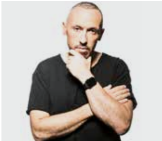
DIRTY SWIFT / samedi de 20h à 21h