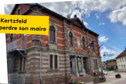
La Mairie de Kertzfeld qui vient de perdre son maire