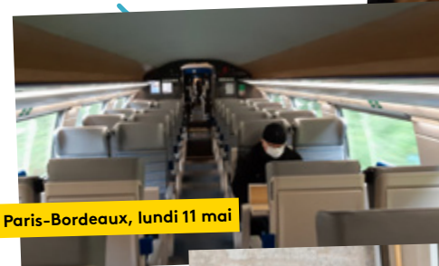
Train Paris-Bordeaux, lundi 11 mai