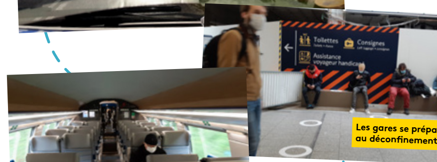
Les gares se préparent au déconfinement