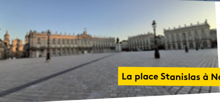
La place Stanislas à Nancy