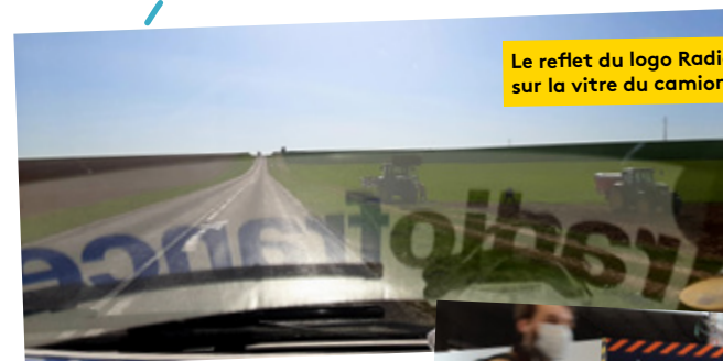
Le reflet du logo Radio France sur la vitre du camion