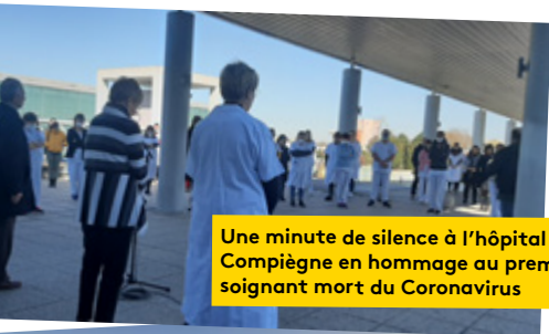
Une minute de silence à l'hôpital de Compiègne en hommage au premier soignant mort du Coronavirus