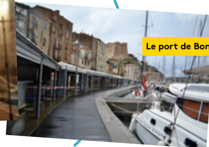
Le port de Bonifacio