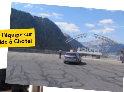
La voiture de l'équipe sur un parking vide à Châtel