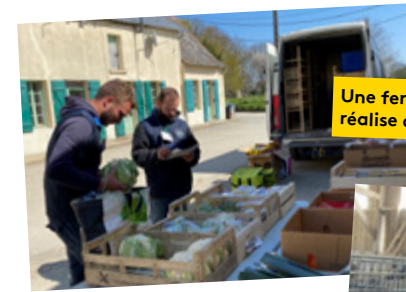
Une ferme en Bretagne qui réalise des livraisons solidaires