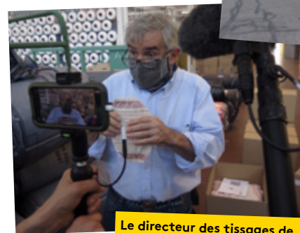
Le directeur des tissages de Charlieu en pleine interview