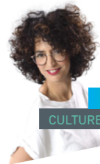
YASMINA CULTURE HIP-HOP