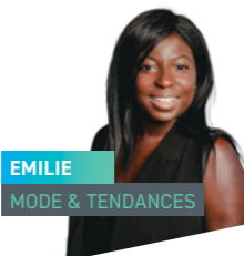
EMILIE MODE & TENDANCES