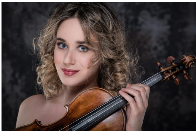
© Anna Tifu - Ernesto Casareto