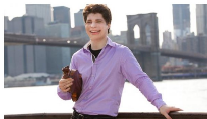
Les visiteurs du National, Augustin Hadelich

MERCREDI 09 MARS 2022 - 20H00 MAISON DE LA RADIO ET DE LA MUSIQUE - AUDITORIUM