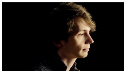
Les visiteurs du National

Retrouvez l'intégralité des programmes des Visiteurs du National ci-dessous et sur le site www.maisondelaradioetdelamusique.fr