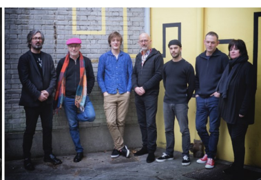
Yves Rousseau Fragments septet