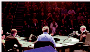
« Le Masque et la Plume », émission de France Inter en public (studio 105)