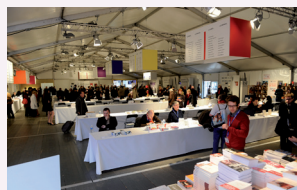
Radio France fête le livre