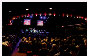
Radio France fête la musique