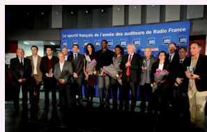
Remise du prix du Sportif français de l'année des auditeurs de Radio France