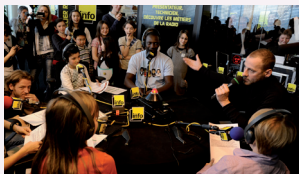
L'atelier radio pédagogique de France Info