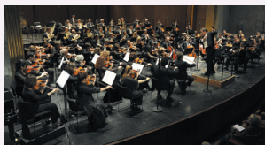
L'Orchestre National de France sous la direction de Daniele Gatti