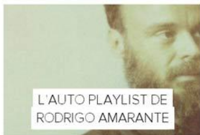
CHRIS COHEN + DORI CAYMMI + BROADCAST + HENRY MANCINI