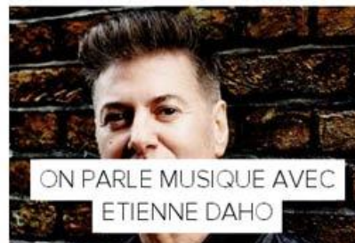
ETIENNE DAHO + SMOKEY ROBINSON + JACCO GARDNER