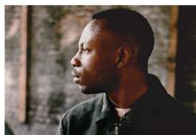
Prose Combat, histoire d'un classique